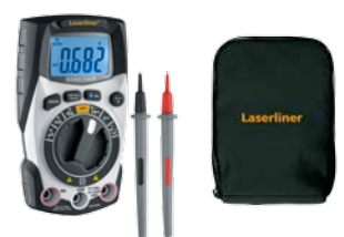
MultiMeter-Pocket XP + 2 puntali di misura + pile + Softbag