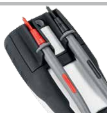
Supporto per puntali di misura