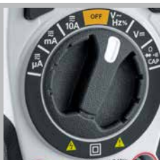
Manopola semplice da usare