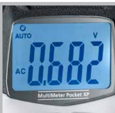
Ampio display LC con retroilluminazione